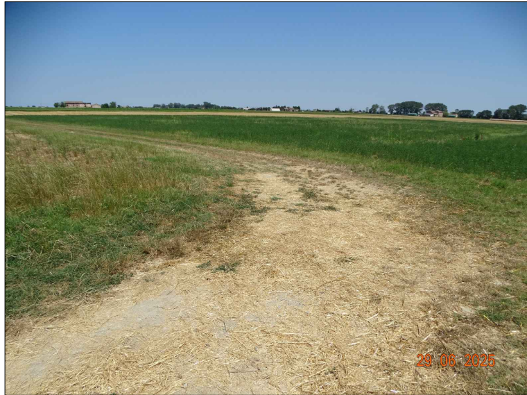
Foto 1 Strada sterrata